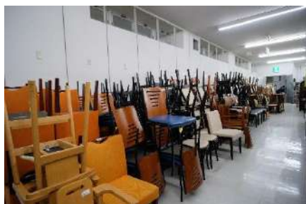
中古家具も豊富。新品もご用意。各種メーカー取扱あり。写真はイメージ。