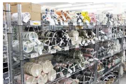
プロ向けの新品食器。用途に合わせて商品をご提案。中古商品も大量販売。