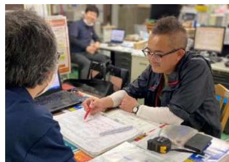
飲食店経営支援として、物件紹介、内装工事の請負、販促、求人支援を行う。