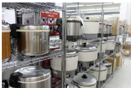
プロ向けの中古調理道具。新品も大量に展示販売。写真はイメージ。