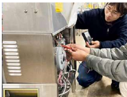
自社で中古厨房機器の買取、修理・再生を行い、品質の高い機器を提供。