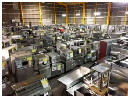
中古厨房機器の取り扱いが国内最大。写真はイメージ。

飲食店経営支援におきましては、新店オープンに向けた物件探しや内装工事、販促、求人の支援を行います。また店舗運営に必要な、電話・ネット回線、クレジット端末、ビール会社紹介等も他社と協業し提供しているため、開業予定者はワンストップで開業準備を進める事が可能です。